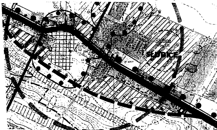
Wrys z Studium uwarunkowań i kierunków zagospodarowania przestrzennego gminy Słubice

Załącznik Nr 1 do Uchwały Nr XXIII/14/2012 Rady Gminy Słubice z dnia 5.10.2012r.